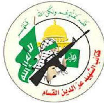
Logo des militärischen Flügels der HAMAS, „Izz-al-Din-al-Qassam-Brigaden“