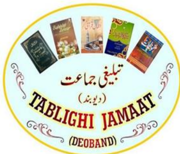
Schriftzug „Tablighi Jama'at“

Das Potenzial der losen islamistischen Anhängerschaft beläuft sich im Freistaat Thüringen auf ca. 200 Personen. Zwei Drittel davon sind der Strömung des Salafismus zuzurechnen. Die übrigen dem AfV bekannten Islamisten verteilen sich auf die Gruppierungen TJ, MB, „Hizb Allah“ und HAMAS sowie die INS.