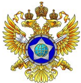
Logo des SWR

Dazu steht der Russischen Föderation ein großer nachrichtendienstlicher Apparat zur Verfügung. In nahtloser Fortsetzung des früheren sowjetischen Geheimdienstes KGB verfügen seine heutigen Nachfolger (der zivile Auslandsnachrichtendienst SWR, der militärische Auslandsnachrichtendienst GRU und der Inlandsnachrichtendienst FSB) nahezu über die gleichen Befugnisse, die konsequent und zielgerichtet eingesetzt werden. Die Steuerung nachrichtendienstlicher Operationen erfolgt hier-