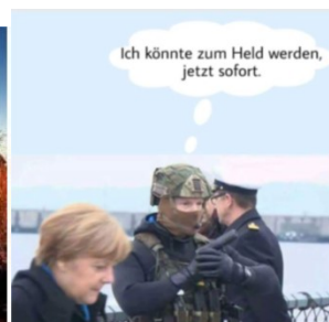
Bilder, welche von Akteuren der „Gruppe G.“ geteilt wurden.