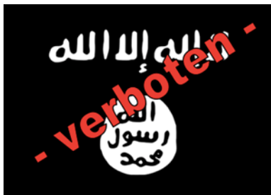
Logo der verbotenen Terrororganisation IS

Der islamistische Extremismus ist kein einheitliches Phänomen, sondern weist zahlreiche Facetten auf. Diese unterscheiden sich zum einen in ihrer Reichweite und ihrem Anspruch; das Spektrum reicht hierbei von lokalen islamistischen Vereinen bis zu global agierenden Organisationen wie den Terrororganisationen „Islamischer Staat“ (IS) oder „al-Qaida“.