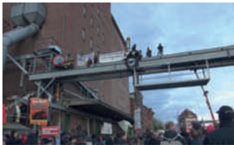
Protestaktion gegen den „Trauermarsch“ in Demmin

Die Proteste und Gegenveranstaltungen zum sogenannten Trauermarsch der rechtsextremistischen Szene am 8. Mai in Demmin (vgl. Abschnitt 2.10)