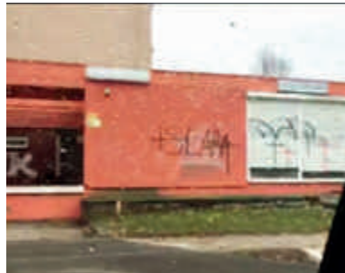
Schmiererei am islamischen Gebetsraum in Rostock-Evershagen

Im Zusammenhang mit dem Protest gegen Asylbewerber wurden hierzulande verstärkt Aktionen registriert, die sich gegen den Islam richten. Der Islam wird in der rechtsextremistischen Szene nicht als eine Religion wahrgenommen, ihm werden vielmehr pauschal politische Absichten unterstellt. Typisches Zielobjekt solcher Aktionen sind muslimische Gebetsräume, wie in Stralsund, vor dem Mitte Juli 2017 ein schwarzes Holzkreuz aufgestellt sowie eine Schweinenase abgelegt wurde.