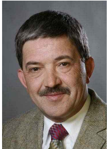
Lorenz Caffier, Innenminister des Landes Mecklenburg-Vorpommern

Demokratie muss wehrhaft sein! Auch im Jahr 2008 hat sich Mecklenburg-Vorpommern als wehrhafte Demokratie bewiesen und sich erfolgreich extremistischen Bestrebungen entgegen gestellt. Die anhaltende weltweite Bedrohung durch islamistische Terroristen, der