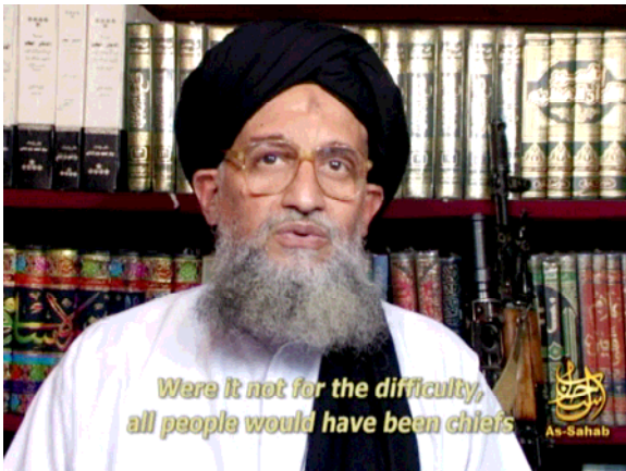
Aiman AL-ZAWAHIRI, Feb. 2008

Abu Obeida AL-MASRI) für die Anschläge auf den Londoner Nahverkehr im Sommer 2005 8 sowie für den im Sommer 2006 vereitelten Anschlag auf die transatlantische Zivilluftfahrt 9 vermuten. Kurz nach dem Selbstmordanschlag auf die dänische Botschaft in der pakistanischen Hauptstadt Islamabad am 2. Juni 2008 bekannte sich al-Qaida auch zu diesem Terrorakt, bei dem mindestens acht Menschen (unter ihnen auch eine Däne) ihr Leben verloren. Auch Deutschland wurde im Jahr 2008 in Internet-Botschaften des al-Qaida -Führers Usama BIN LADIN und seines Stellvertreters Aiman AL-ZAWAHIRI