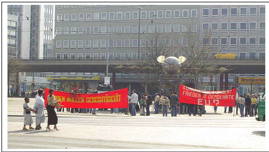
KONGRA-GEL-Sympathisanten während einer in Bremen abgehaltenen Demonstration am 17. April 2004.

bevorstehenden EU-Beitrittsverhandlungen erwiesen sich für den KONGRA-GEL in Bremen offensichtlich als Bindeglied zur Anhängerschaft. Anfang Dezember 2004 organisierte das MED-Kulturzentrum einen Marsch mit vorwiegend Jugendlichen, die als besonders treue Anhänger ÖCALANs gelten, von Delmenhorst (Niedersachsen) nach Bremen. Die von den Veranstaltern vorsichtig kalkulierte Teilnehmerzahl von 40 bis 60 Demonstranten wurde erreicht. Die Forderungen bestanden in einer stärkeren „EU-Beteiligung“ der Kurden sowie einer Verbesserung der Haftbedingungen für den „Volksführer“.